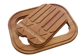
Twin 伊罗科木砧板 8644 003