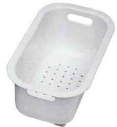
白爪篱 8151 100