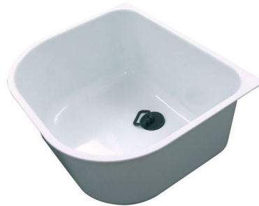
白托盘 8152 100 * 仅与附件结合使用 8100 112