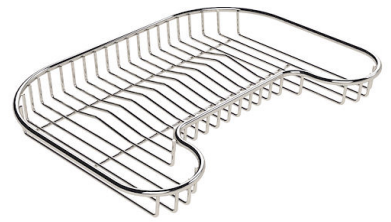
不锈钢背板 8100 111